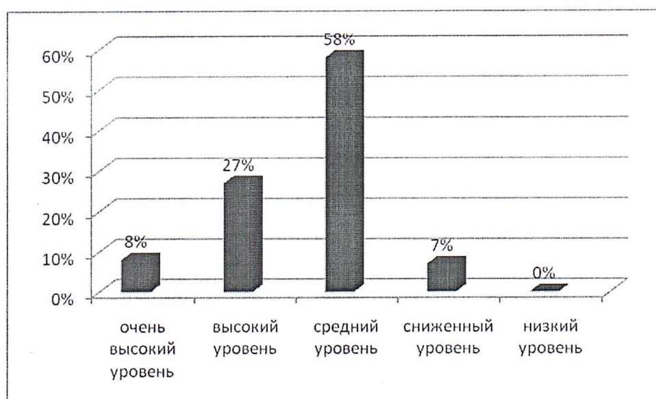
Рисунок 1 – Гистограмма результатов диагностики М.И. Лукьянова «Мотивация обучения» (выраженность в %)

В результате мониторинга мотивации обучения 1-11 классов МБОУ СОШ № 4 п.г.т. Сосьва выявлено 8 % обучающихся с очень высоким уровнем мотивации, преобладание учебных мотивов, возможно наличие социальных мотивов. 27 % обучающихся имеют высокий уровень учебной мотивации, преобладание социальных мотивов, возможно присутствие учебного и позиционного мотивов. 58% обучающихся имеют нормальный уровень мотивации, преобладание позиционных мотивов, возможно присутствие социального и оценочного мотивов. У 7 % обучающихся сниженный уровень мотивации, преобладание оценочных мотивов, возможно присутствие позиционного и игрового (внешнего) мотивов. Низкий уровень мотивации не выявлен.